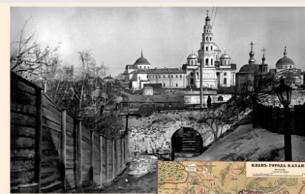
А Казанский Богородицкий монастырь. Вид на монастырь и колокольню XVII в. Фото нач. XX в.