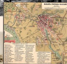
А С. Монастырский. План города Казани. 1884 г. ГПИБ